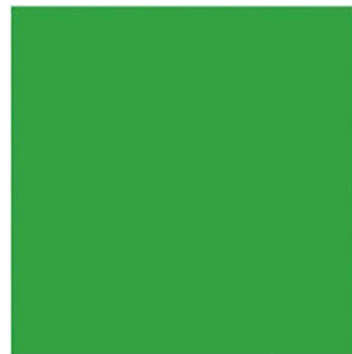
zelená - green