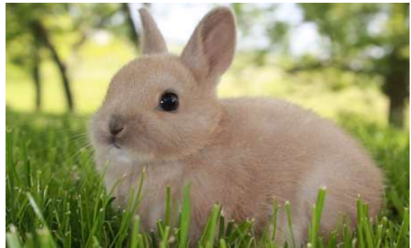
králík - rabbit