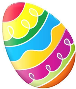
vejce - egg